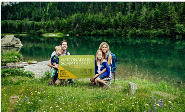
Die Nationalpark Sommercard mobil.