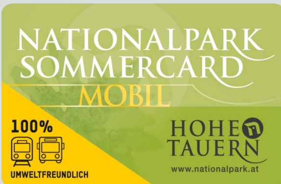
60 Leistungen, darunter alle öffentlichen Verkehrslinien sind in der Sommercard inkludiert.

Passend zur Attraktivierung des öffentlichen Verkehrs werden die Wanderungen mit den Nationalpark Rangern übrigens zukünftig noch besser an das öffentliche Verkehrsnetz angepasst werden und Treffpunkte mit Bahn oder Bus erreichbar sein.