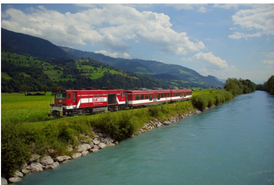
Mit der integrierten Pinzgauer Lokalbahn die Sehenswürdigkeiten erkunden

Diese Aufwertung des öffentlichen Verkehrs soll zu einer Entlastung der Region durch die negativen Auswirkungen des Autoverkehrs insbesondere auch der sensiblen Seitentäler in der Nationalparkregion beitragen.