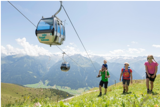
Sämtliche Bergbahnen in der Region sind inkludiert