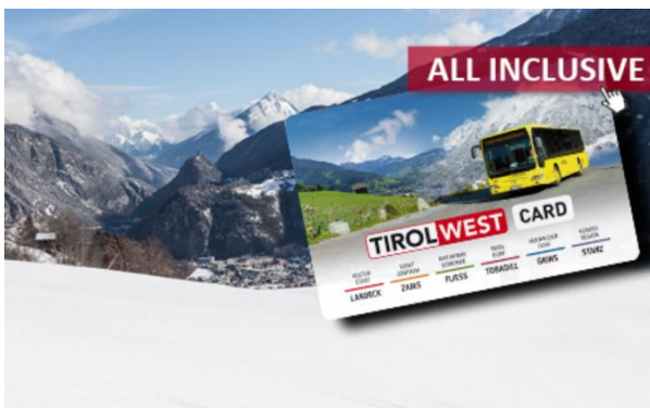
Die Tirol West Card – all inclusive