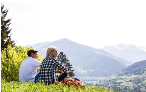
Mit klimafreundlicher Mobilität die Ressource Natur schützen.

Diese informiert nicht nur über die Mobilitätsangebote vor Ort, sondern bietet auch umfassende übersichtliche Informationen zur klimafreundlichen Anreise mit Bahn und Bus. Eine direkte Fahrplanabfrage, mittels der öffentliche Verbindungen in die Ferienregion von allen Ausgangsorten der Welt, angezeigt werden, ist ebenso inkludiert.