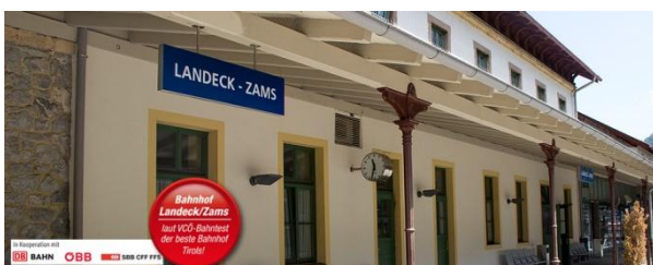
Bahnhof Landeck-Zams als wichtiger ÖV-Knotenpunkt

Zu den nachhaltigen Mobilitätsangeboten vor Ort zählt auch ein E-Bike-Verleih, der ebenfalls von klimaaktiv mobil unterstützt wurde.