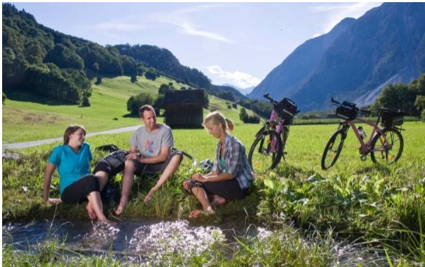
Radfahren in der Tirol West Region